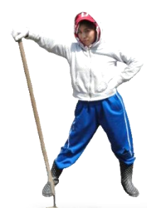
みんなで草むしり♪